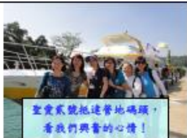
聖愛號抵達營地碼頭， 看我們興奮的心情！