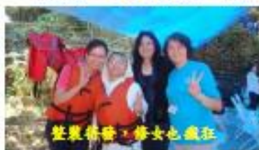
整裝齊發，美女也瘋狂