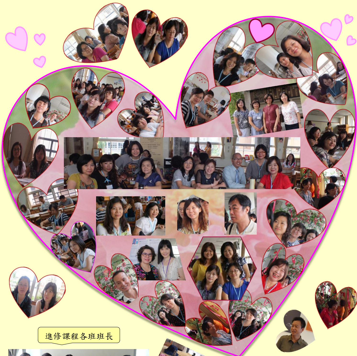
進修課程各班班長