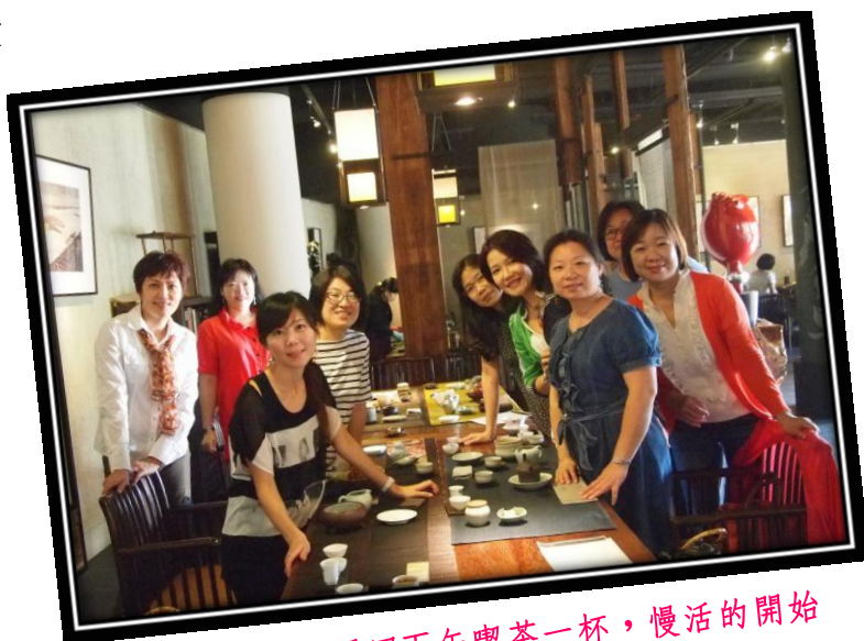
茶道慢活樂：週四下午喫茶一杯，慢活的開始

曉明愛心媽媽合唱團是由一群在校和畢業媽媽因熱愛音樂而組成，平日以每星期五早上於學校的合奏教室練習，經常配合學校及各縣市活動演出。