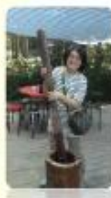
益謀主任解說傳愛580釣竿計劃

早上讓我們用光體力，下午讓我們花光積蓄，不知是否是隊長的用意？帶著意猶未盡，期待下次的再出動。