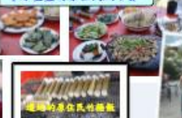
這類的原住民竹筒飯

2012.10.26天好藍、湖好綠、景好美、人好靚，這是此次秋遊最貼切的寫照。雖然熱陽高照，30度以上的高溫，但有涼風吹拂，每個人的心也飛揚起來。