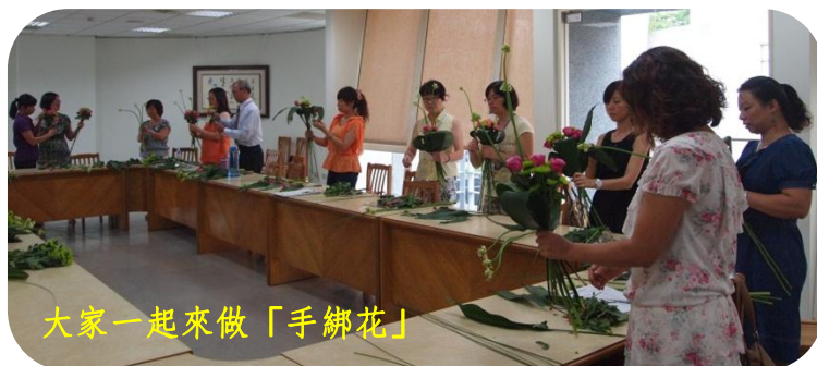
大家一起來做「手綁花」

第一次上課，老師以「手綁花」帶領我們入門。五種花及葉的變化，伯利恆之星、葉蘭、玫瑰、小綠菊、大雄草，依各人思維及喜愛，把這樣不同的花材組合，也練習手感。說似簡單，倒也讓我們這群「精英班」手腳忙亂一番，席間老師穿梭的身影，不斷提醒：同學們，要慢慢來！要慢…慢…來！