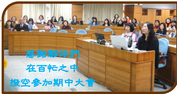
感謝夥伴們 在百忙之中 撥空參加期中大會