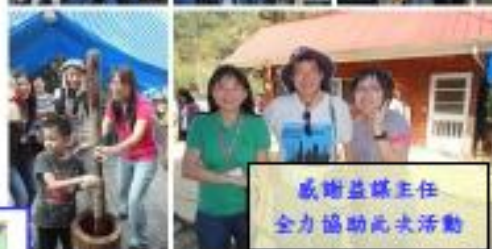
感謝益謀主任全力協助此次活動