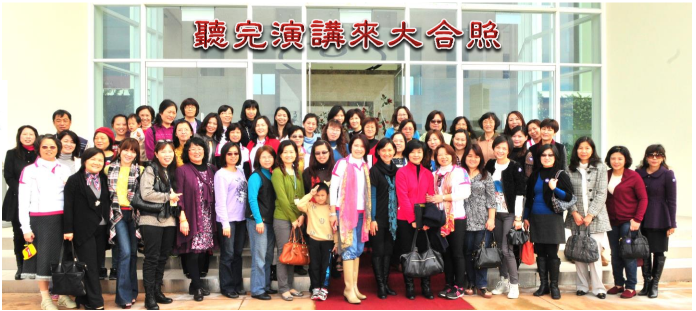
美魔女媽媽示範站姿、顯瘦