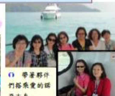
帶著夥伴們搭乘愛的諾亞方舟