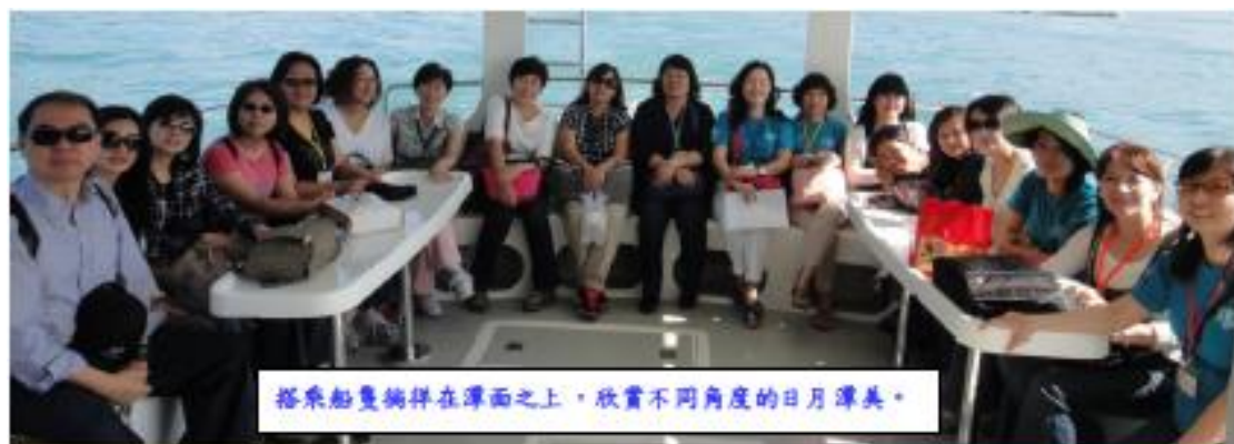
搭乘船隻徜徉在潭面之上，欣賞不同角度的日月潭美。