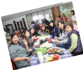
謝謝學校提供豐盛又美味的午餐