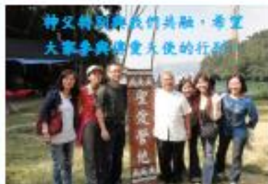
神父特別與我們共融，希望 大家參與傳愛天使的行列