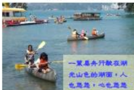
一覽扁舟行駛在湖光山色的湖面，人也悠悠，心也悠悠