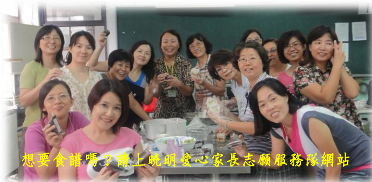
想要食譜嗎？請上曉明愛心家長志願服務隊網站