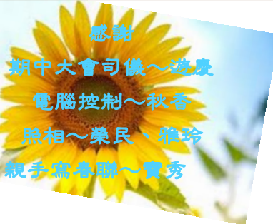
感謝 期中大會司儀~遊慶 電腦控制~秋香 照相~榮民、雅玲 親手寫春聯~寶秀