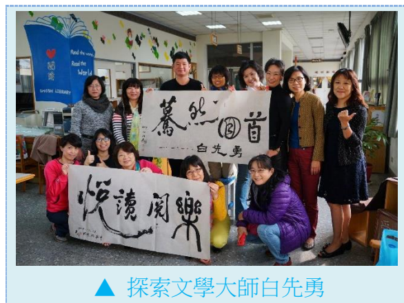
▲ 探索文學大師白先勇

在學校推動閱讀最困難的應是：堅守不干擾、不影響校務的狀況下支援教學，這中間志工角色的拿捏是志工隊成功與否的關鍵。99年開始加入「曉明百閱」親子書目的建置，並開始協助題庫建置的工作。101年開始，我們開始另一個新的里程碑—世界書香日—在全校票選出來的閱讀樹下舉辦親師生一起歡喜閱讀的書香日活動，而這活動就是在寓教於樂中成功舉辦的閱讀活動。104年聖誕節配合圖書館中