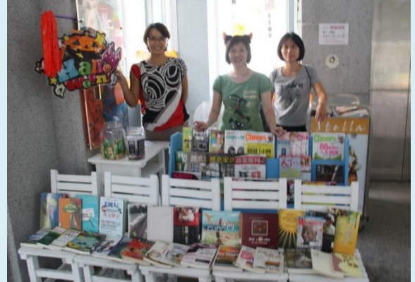
▲配合萬聖節，粉墨登場