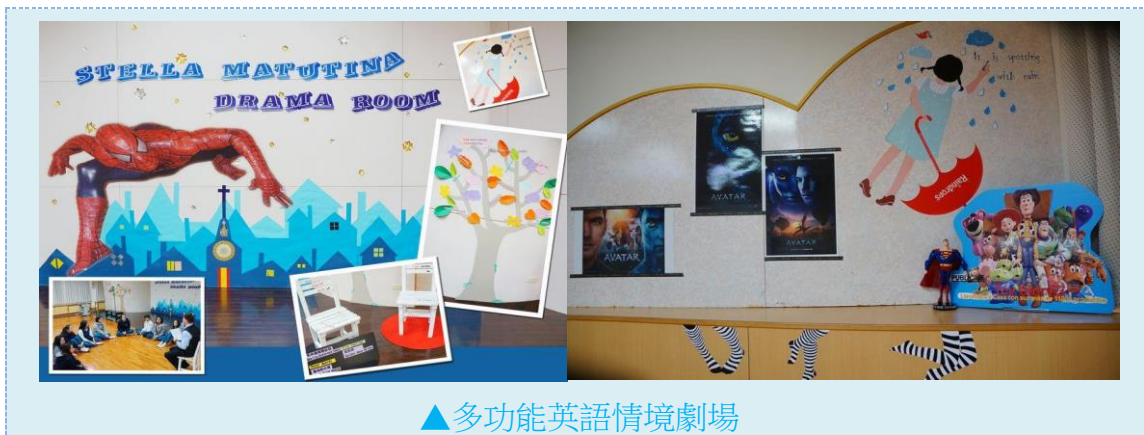
▲多功能英語情境劇場