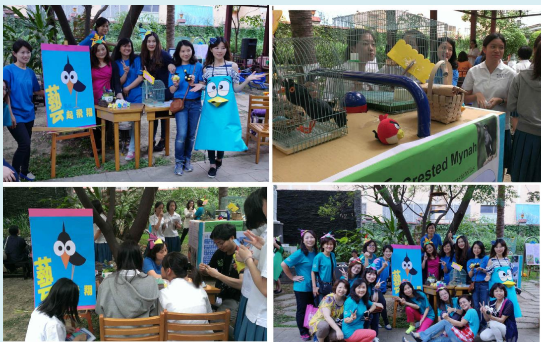
▲學生到技能科關卡：「藝起飛翔」實作互動情形

技能科藉由海報文字及物件的呈現，讓學生了解八哥鳥的特徵及習性。透過摺紙及實作互動，提升學生閱讀和學習的興趣。