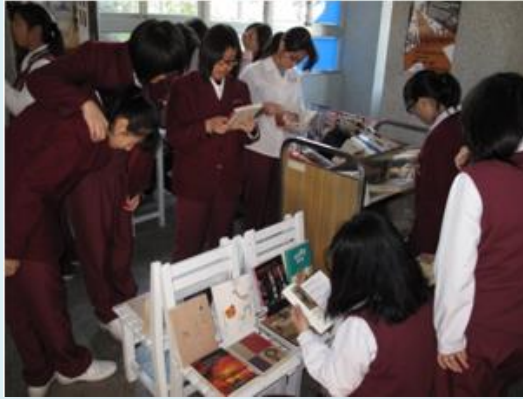
▲Stella 移動城堡，深受學生喜愛