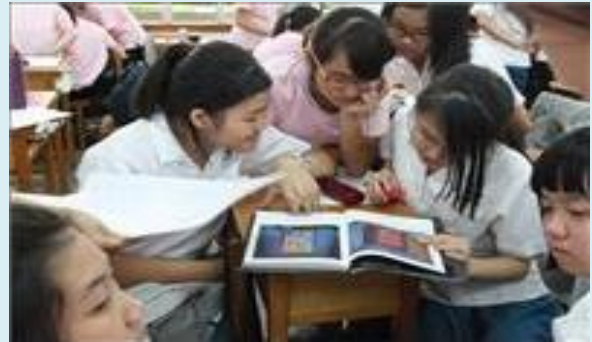
▲閱讀開啟孩子生命之窗讓夢想起飛

「以愛傳愛，以愛舞動生命」，「愛」蘊藏在曉明女中校園的每個角落——這所堅持「全人教育」的學校——在落實「全人教育」的過程中，如何豐富孩子的生命、落實全人教育理念，「閱讀教育」占著很重要的角色。因此這廿一年來我們曉明女中愛心家長志願服務隊（以下簡稱曉明愛心工作隊），也秉持著「與愛同行」積極配合學校推動閱讀。學校積極而循序漸進的在青春園地中推動閱讀，並在一〇三年以「青春閱樂園」獲得教育部閱讀磐石學校的肯定，這樣的肯定讓學校、愛心工作隊及學生都受到很大的鼓勵，也間接的肯定我們「與愛同行，『閱樂園』推閱樂」的理念，讓我們更有信心也更積極的參與學校的各項閱讀推廣業務，也在其中真的發揮效益。