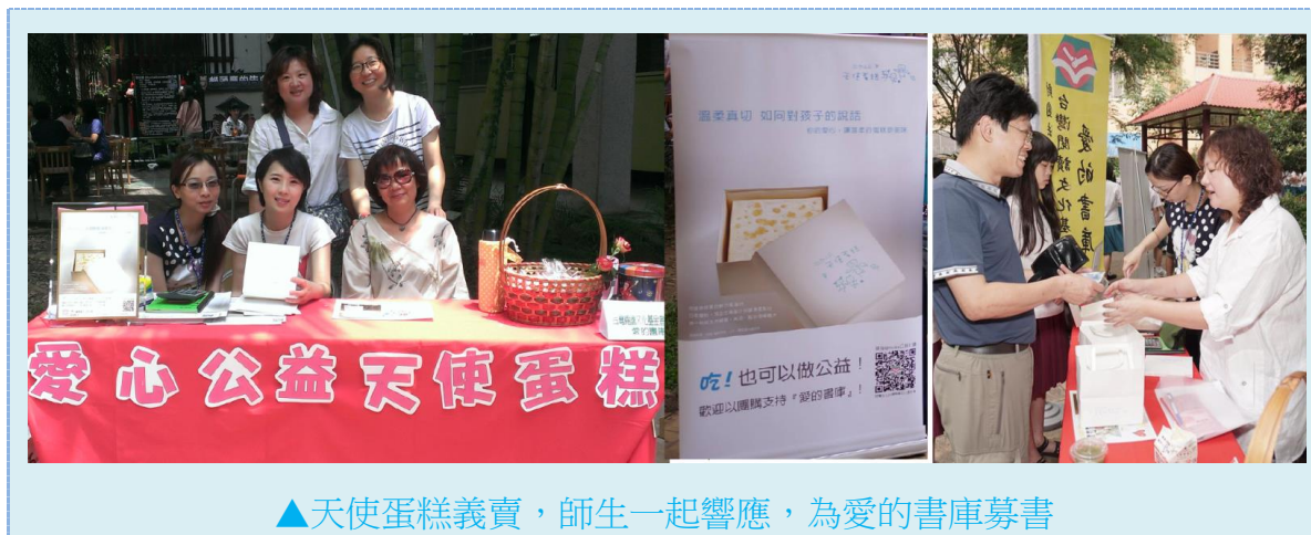
▲天使蛋糕義賣，師生一起響應，為愛的書庫募書