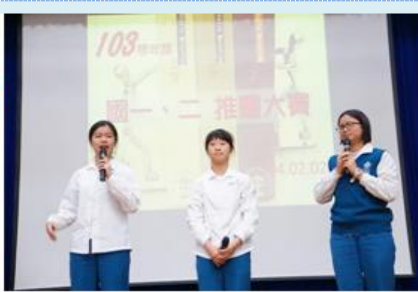
▲國一國二推書大賽擔任評審