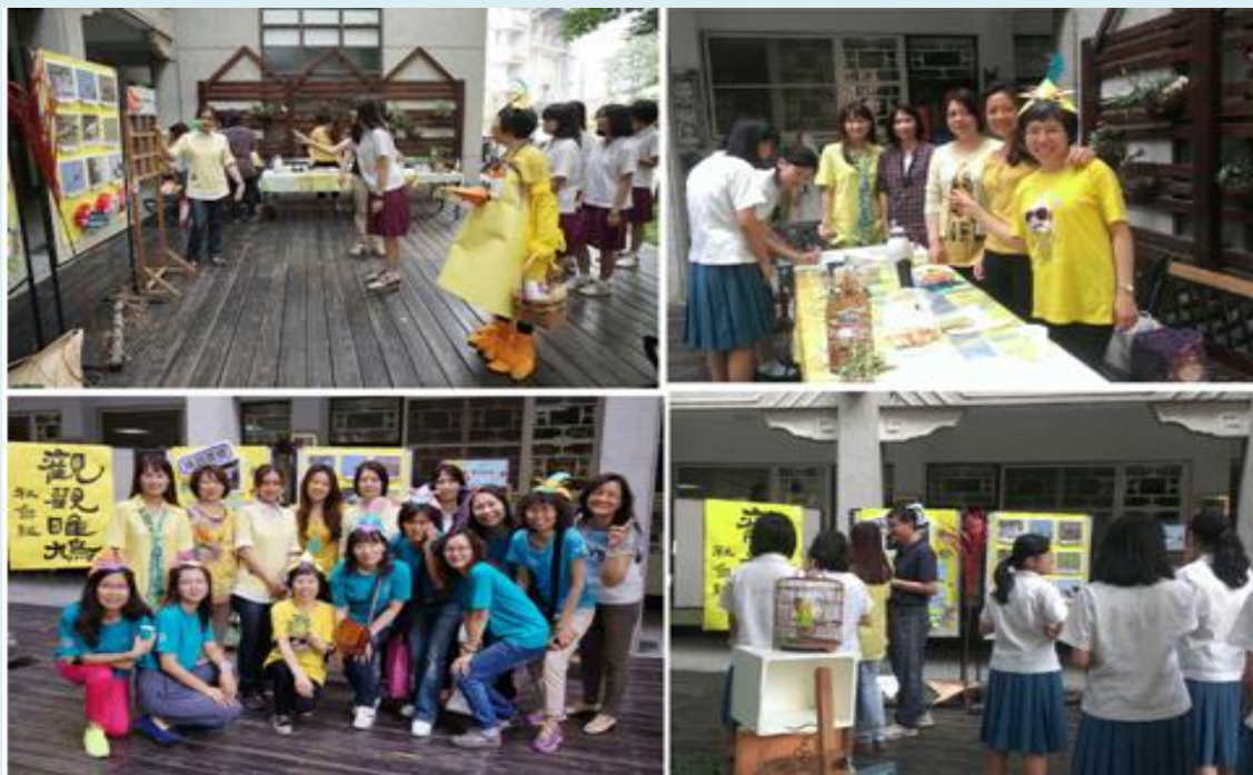
▲學生到社會、自然科關卡：「觀觀睢鳩」闖關情形

社會及自然科藉由和人類最親近的珠頸斑鳩「斑甲」(台語)，認識最常出現在校園的鳥類。透過海報介紹及遊戲，引導大小朋友們了解：賞鳥倫理五「不」曲：不引誘、不追逐、不驚嚇、不破壞、不捕捉，讓大家發自內心維護地球的鳥類朋友們。