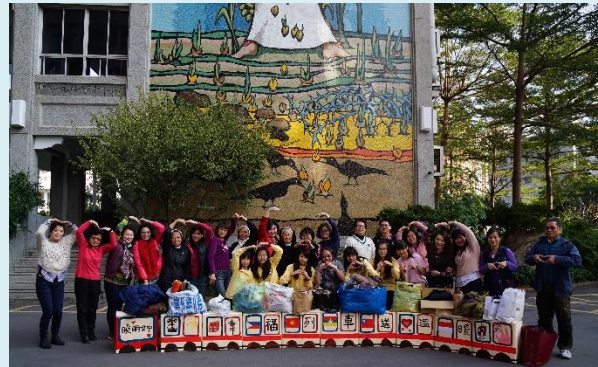
▲中青文創營傳愛列車為東南亞漁工募冬衣