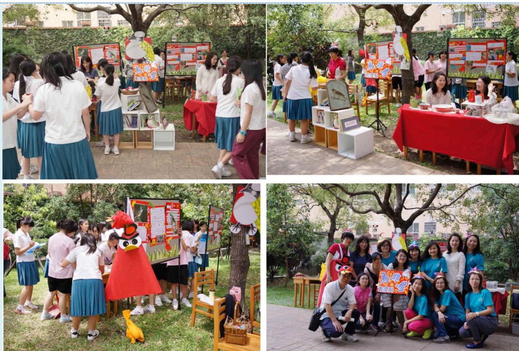
▲學生到數學科關卡：「鳥非鳥」闖關情形

數學科藉由生活中常見、活潑好動且不太怕人的白頭翁特性，來設計問題並融入數學觀念，讓學生忘卻對數學的排斥進而享受數字的魔術。