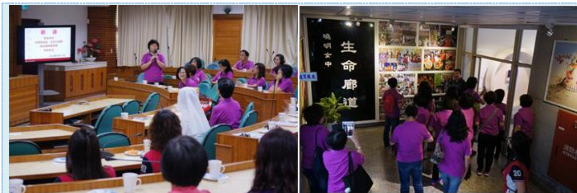
▲ 德光女中愛媽服務團蒞校參訪交流

愛心工作隊至德光女中及聖功女中取經，發現她們有訓練專門的解說人員，且組織完整，都是值得我們學習的。今年德光女中愛心媽媽服務團也蒞校參訪互相交流。