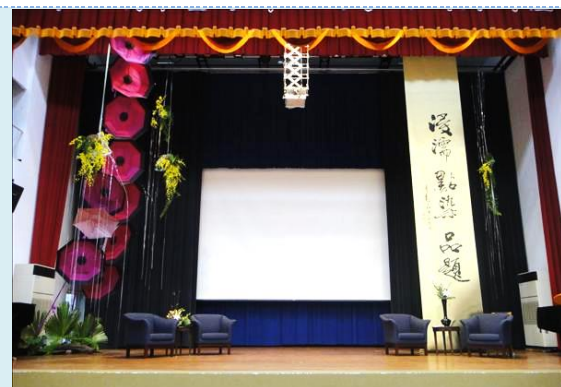
▲ 頒獎典禮舞台布置

第 8 屆中臺灣聯合文學獎頒獎典禮由圖書館主辦，工作隊除了協助得獎選手作品集的校稿工作外還負責協助頒獎日的舞台布置，讓頒獎典禮在簡單隆重中更出色。再者，配合學校講座協助講場情境布置，除讓講場氛圍更好也讓工作隊隊員可以展現自己的才華。