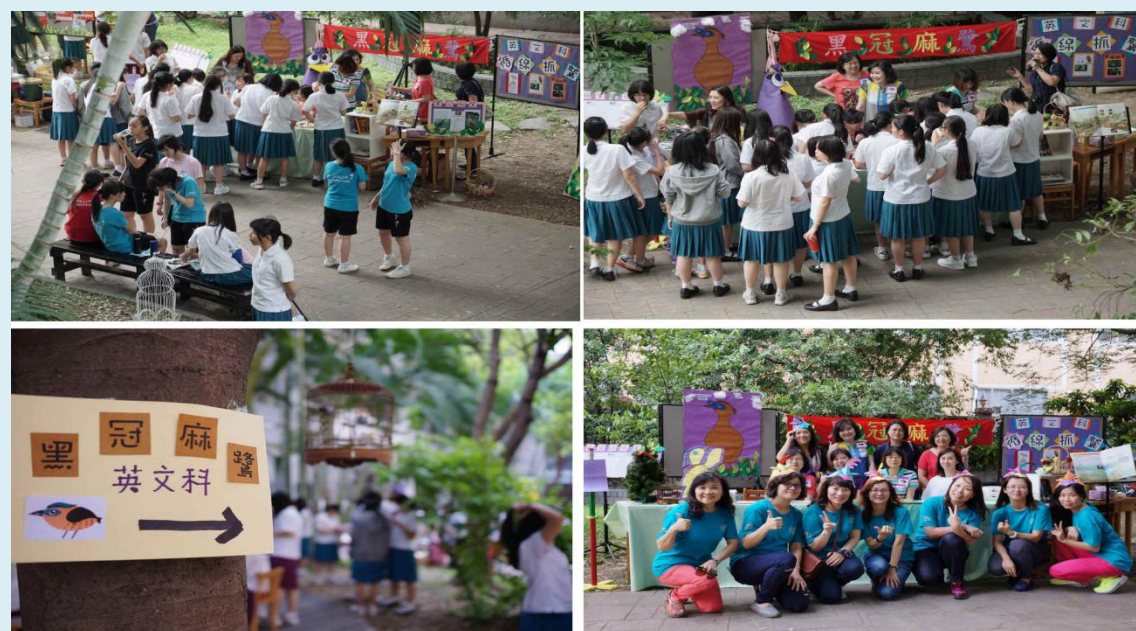
▲學生到英文科關卡：「循線抓鳩」闖關情形

英文科藉由英文繪本、鳥類圖鑑、闖關活動拼出鳥類的英文單字等遊戲，讓孩子們對都市棲地的生態有更深的認識、對物種生命的關懷，進而推展都市生態保育工作。並能珍惜生存環境用心保護地球。