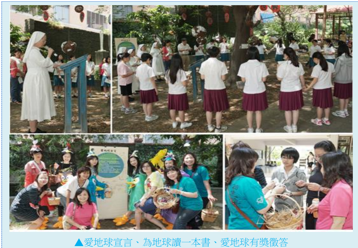
▲愛地球宣言、為地球讀一本書、愛地球有獎徵答