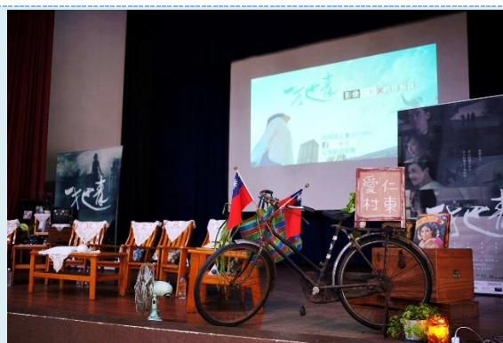
▲ 105/1/6 一把青校園講座講場布置