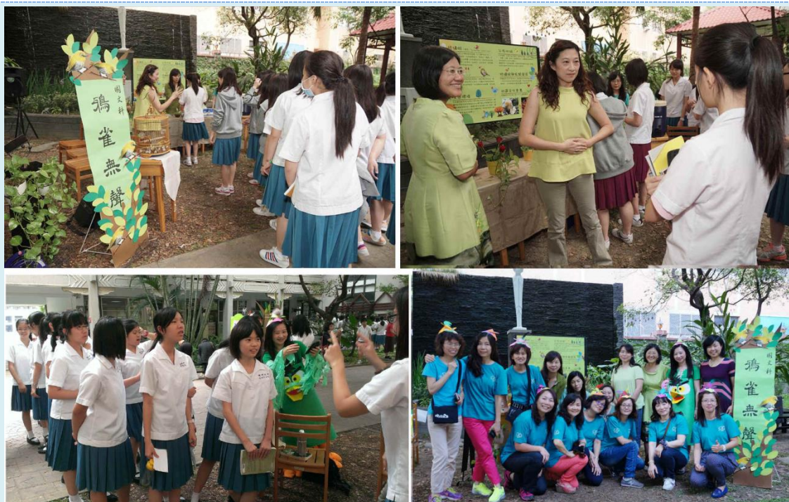
▲學生到國文科關卡：「鴉雀無聲」闖關情形