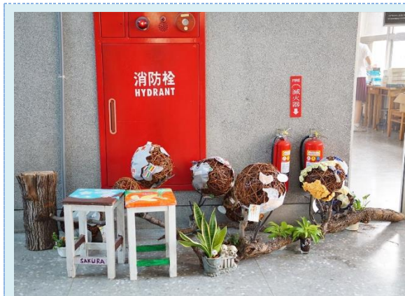
▲閱讀角落布置一隅

在校園的各個空間營造優雅的閱讀環境，讓書香滿校園，也是我們的重要目標之一，因此在校園中學生可以處處與書相遇，坐在某個角落閱讀。