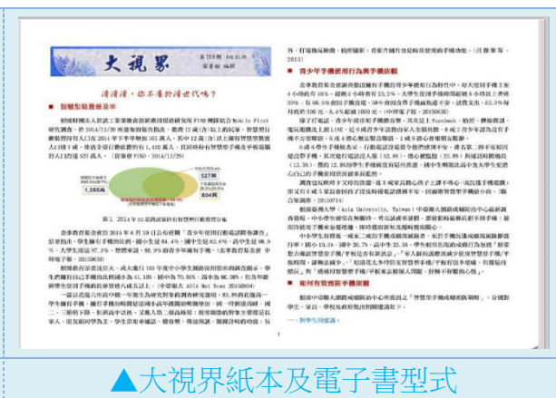
▲ 大視界紙本及電子書型式