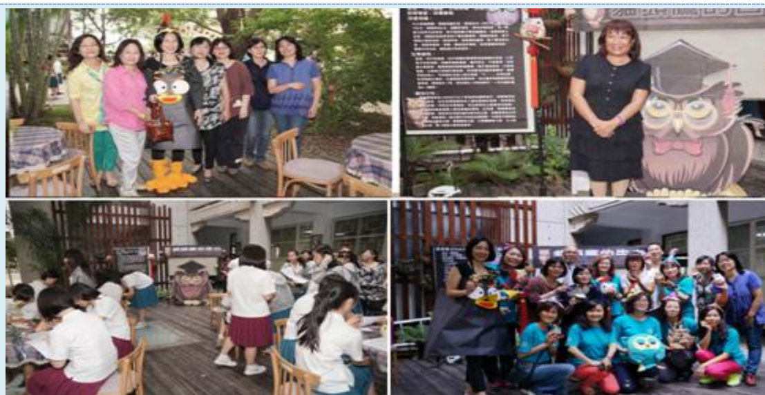
▲學生到生命教育科關卡：「貓頭鷹的告白」闖關情形

生命教育科透過動物界智者貓頭鷹的告白，讓同學了解地球只有一個，我們每一個人的行為都會影響整個地球的生態發展，所以如何做節能減碳的工作來救地球，讓地球的每一種動物都有居住與生存空間。可喜的是，今年真有一對貓頭鷹在校內繁衍，讓師生非常開心的歡迎這個新家族融入曉園大家園中。