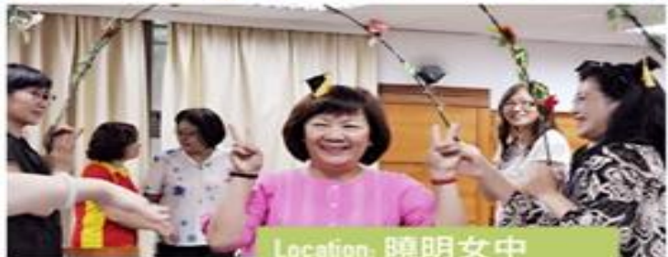
Location: 曉明女中 Date: 2017. 06. 02