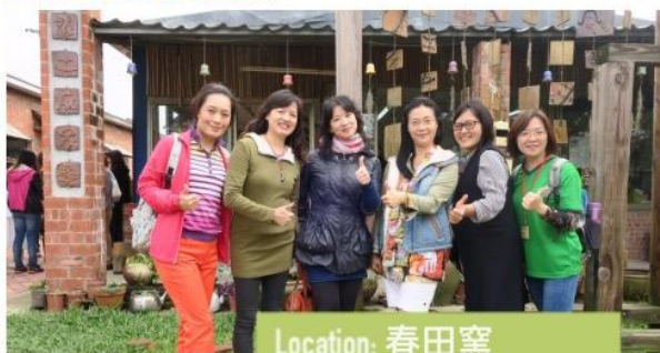
Location: 春田窯 Date: 2016.11.24