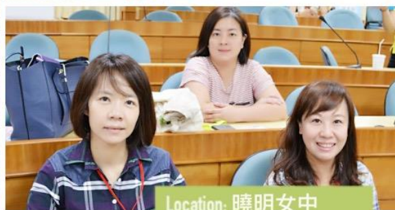
Location: 曉明女中 Date: 2016. 09. 02

一早送了女兒到校後，我就來會場報到了!是的，就是因為迫不及待，讓我成為第一個報到的愛心媽媽。