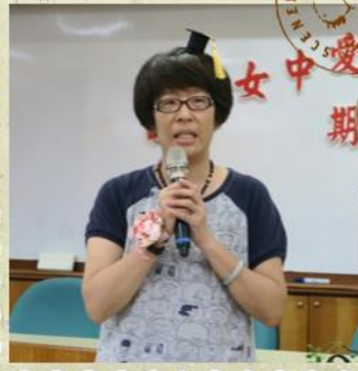
Try to stay positive on vacation!